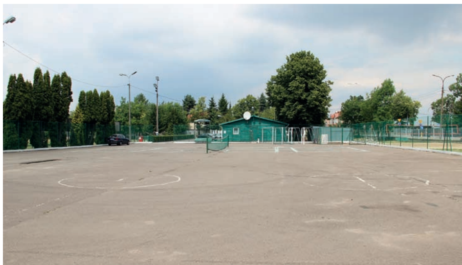
Tu powstanie hala sportowa