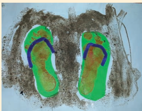
Kacper Durasiewicz – 5lat