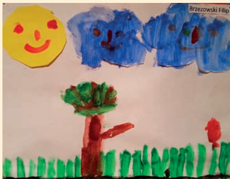
Filip Brzezowski – 6 lat