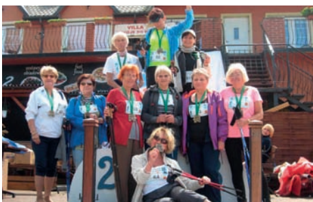
Zwycięska drużyna Seniorek

Seniorzy z Klubu Seniora przy CKR w Raszynie przebywali w dniach 19-26.06.br na wycieczce w DarłóWKu. W czasie pobytu 10 Pań z naszego Klubu uczestniczyło w ogólnopolskich zawodach w Jarosławcu, zorganizowanych przez Polską Federację Nordic Walking o Puchar Pomorza. Uczestnictwo naszych Pań okazało się niespodziewanym, wielkim