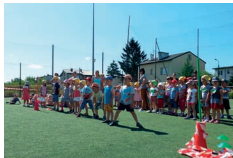
Która drużyna wygra

A co dzieci robią w wakacje w Przedszkolu? To samo, co przez pozostałe 10 miesięcy roku szkolnego, uczą się i bawią,