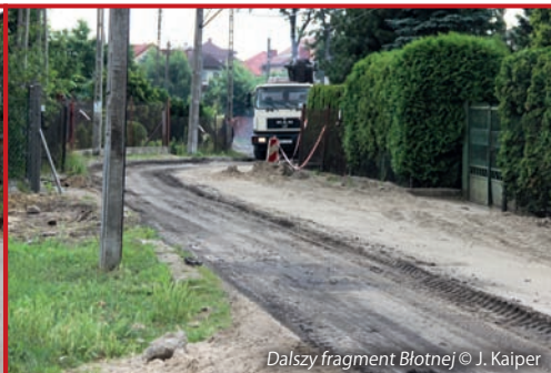
Dalszy fragment Blotnej