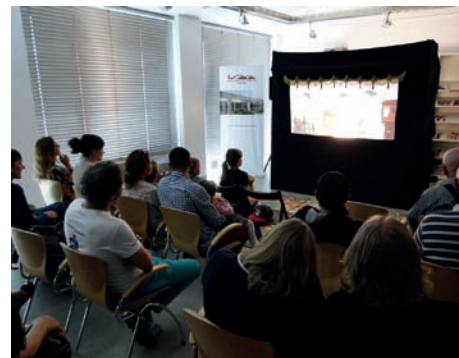
Teatr cieni podczas spektaklu

i Hacivat – pracują na łodzi, przewożąc ludzi na drugi brzeg Bosforu, by udowodnić swoim żonom, że potrafią zarabiać. Ich klientami zostają zupełnie różne od siebie osobowości: bogaty młodzieniec, wiecznie przysypiający opiumista, przybyły z Afryki Arab oraz biegły w sztuce zbijania cen Żyd. Widzowie mieli okazję przekonać się, że każdy kurs dwóch niezbyt doświadczonych przewoźników wygląda inaczej i obfituje w różnego rodzaju niespodzianki. Po spektaklu młodzi i starsi widzowie mogli poznać historię tureckiego teatru oraz sami spróbować swoich sił z drugiej strony podświetlonej sceny. Szczególnym zainteresowaniem cieszyły się wielobarwne skórzane lalki i scenografie przypominające witraże. Dziękujemy wszystkim, którzy niedzielne popołudnie postanowili spędzić w bibliotece z kulturą orientalną, której przedstawiciele licznie zamieszkują na terenie naszej gminy.