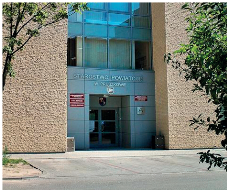
Starostwo powiatowe

W czerwcu podczas posiedzenia Komisji Inwestycji i Rozwoju Gospodarczego w Starostwie Powiatowym w Pruszkowie opracowaliśmy wstępne założenia programowe do strategii ścieżek rowerowych. W przeddzień Komisji w powiecie odbył się konwent Wójtów, Burmistrzów i Prezydentów Gmin i Miast wchodzących w skład Powiatu Pruszkowskiego, podczas którego władarze przedstawiali swoje plany dotyczące tego tematu.