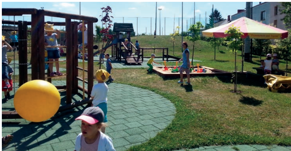
Na takim placu zabaw nikt się nie nudzi

Nadeszło upragnione lato, a wraz z nim czas wakacji. Dla wielu to czas odpoczynku, wytchnienia, dobry moment na dalsze i bliższe podróże, spotkania z najbliższymi. Jednakże okres wakacyjny tylko dla niewielu dorosłych może trwać przez 2 miesiące. Aby zapewnić zapracowanym rodzicom opiekę nad ich pociechami przedszkola z Gminy Raszyn, jak co roku, zorganizowały dyżury wakacyjne. W związku z ogromnym zainteresowaniem przedszkola w systemie zmianowym co 2 tygodnie, od 1 lipca do 31 sierpnia, zapewniają podopiecznym aktywne wakacje. W tym roku, jako pierwsze, zaprosiło dzieci Przedszkole nr 1 „Pod Topolą” w Raszynie przy ul. Pruszkowskiej.