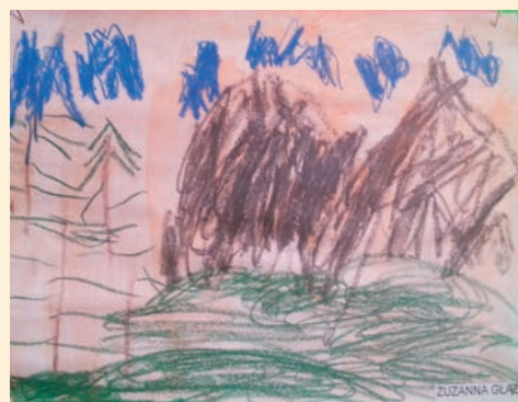
Zuzia Glaz – 4 lata