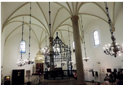
Synagoga w Kazimierzu Krakowskim