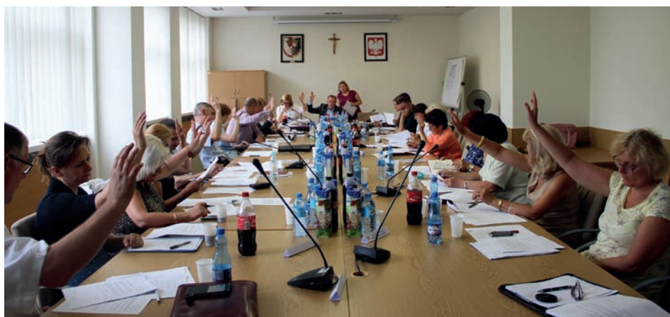
IX Sesja Rady Gminy Raszyn

Rada Gminy podjęła również uchwały związane z zadaniami wykonywanymi przez GOPS: dokonała zmian w Statucie GOPS, odrębną uchwałą przyznała kierownikowi tego ośrodka upoważnienie do prowadzenia postępowania w sprawach przyznawania pomocy socjalnej oraz rozpatrzyła regulamin udzielania pomocy materialnej dla uczniów zamieszkałych na terenie Gminy Raszyn.