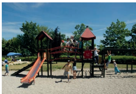
Na placu zabaw przy basenie