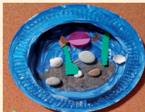
Kornelia Kardasiewicz – 5 lat