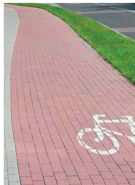
Ścieżka rowerowa