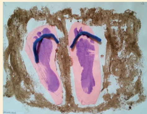
Jakub Polakowski – 5 lat