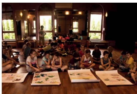
Zajęcia plastyczne w Świetlicy