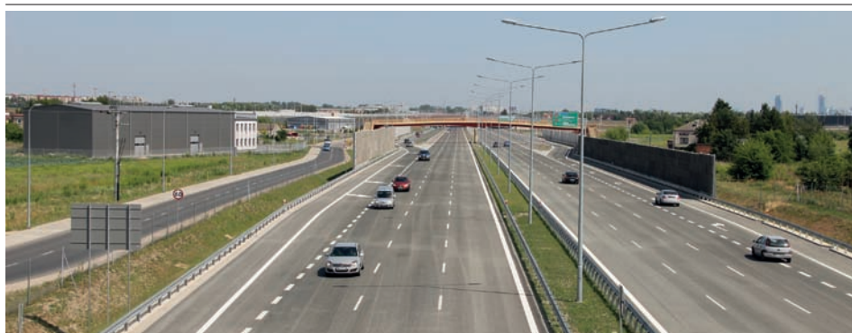
Widok na trasę z Wiaduktu Pruszkowska