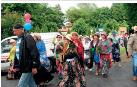
Korowód Świątojański