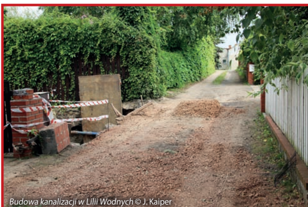
Budowa kanalizacji w Lili Wodnych

Kanał deszczowy rozsączający będzie wykonany na odcinku 234,5 m. Roboty rozbiórkowe istniejącej nawierzchni, a następnie odtworzenie nawierzchni wykonane zostaną przez firmę STRABAG, realizującą, na zamówienie GDDKiA budowę odcinka drogi ekspresowej S8. Termin realizacji zamówienia wyznaczono na 25.09.2015r.