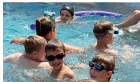
Zabawy w kołowrotku na basenach w Mszczonowie