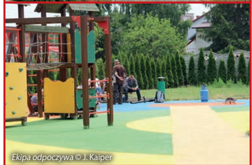
Ekipa odpoczywa