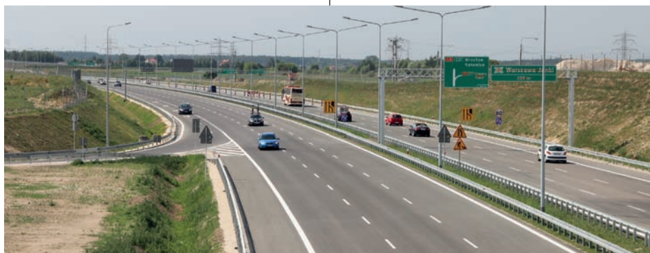
Węzeł Sokołowska