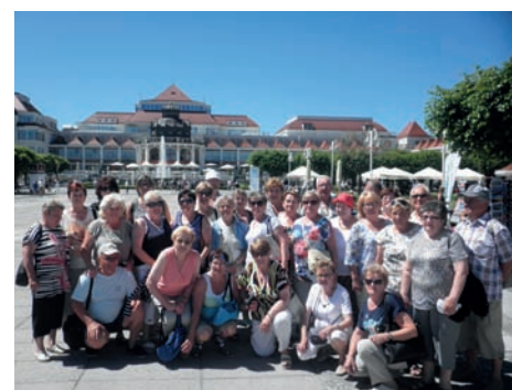
Seniorzy z Rybia