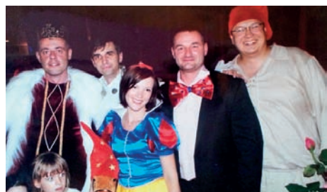
Królowna Śnieżka

Zadaniem każdego nauczyciela, a w szczególności nauczyciela wychowania przedszkolnego, jest przygotowanie dzieci do życia we współczesnym świecie oraz edukacji szkolnej. Zabawa w teatr może stać się jednym ze sposobów wychowywania dzieci, dając im możliwość spontanicznej zabawy, oderwania rzeczywistości, budując poczucie własnej wartości, pomagając przełamać lęki, kształtować i pielęgnować poprawną mowę. Poprzez udział w inscenizacjach dziecko rozwija wyobraźnię oraz uczy się zgodnej współpracy w grupie. Kilka lat temu podczas zebrania zaproponowałam rodzicom utworzenie Teatru Rodzicielskiego. Propozycja zaowocowała powstaniem teatru Rodzicielskiego „Wesoła Nutka”. Rozpoczęta wówczas przygoda trwa do dziś. Wspólnie ustaliliśmy harmonogram spotkań i zabraliśmy się do ciężkiej pracy: nauki