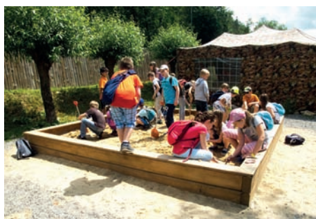
Zabawy w piasku lubią wszyscy