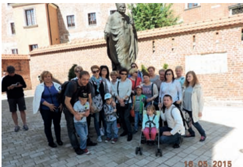
Grupa mieszkańców Wypęd w Krakowie