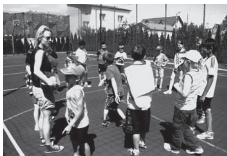
Na boisku