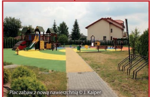
Plac zabaw z nową nawierzchnią