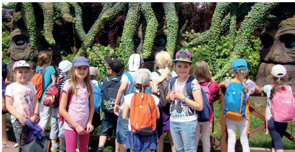
Mordole z Magicznych Ogrodów

„Do aktywnych świat należy” – pod takim hasłem dzieciom naszej szkoły upływał czas na półkoloniach letnich. Na podbój tego co ciekawe i nieznanne wyruszyliśmy 29 czerwca.