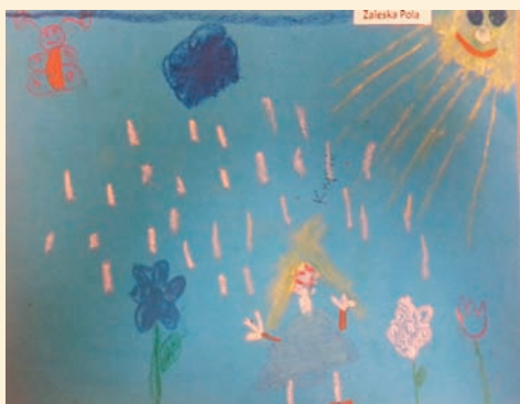
Pola Zaleska – 6lat