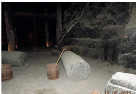
Batwan soli