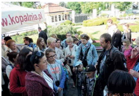
Mieszkańcy czekają na wejście do kopalni