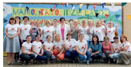
Naszej kadry wspólna cecha, że bez przerwy się uśmiecha