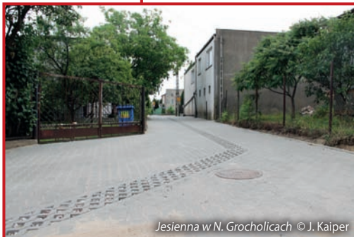
Jesienna w N. Grocholicach

Ulica Blotna ma już zbudowane odwodnienie. Teraz ekipa drogowców frezuje stary asfalt i przygotowuje podkład pod nową nawierzchnię.