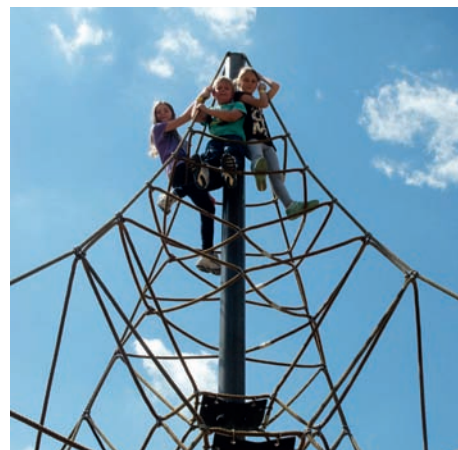
Niemal w chmurach