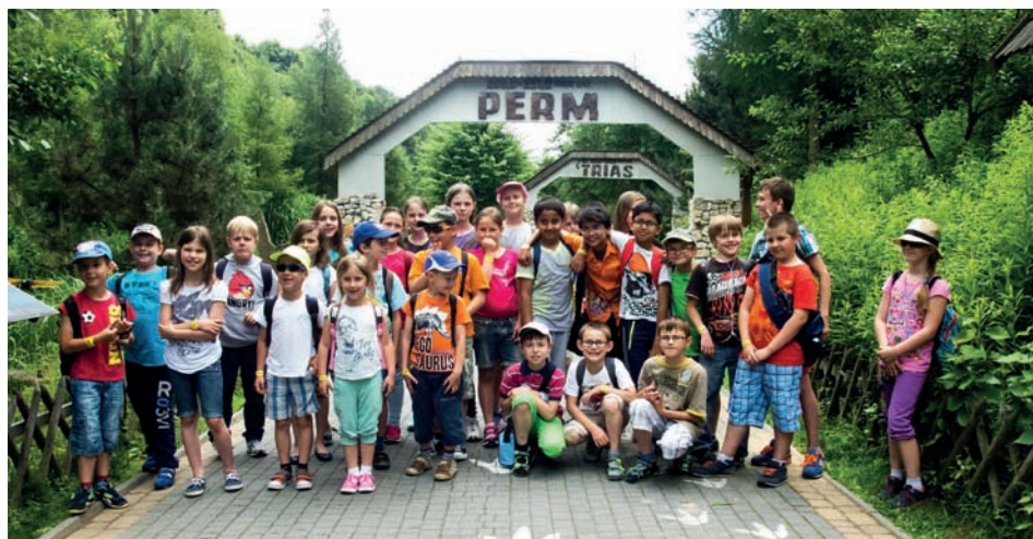
Wycieczka do Parku Dinozaurów w Bałtowie

Za nami dwa tygodnie akcji. W tym czasie dzieci były w Parku Dinozaurów w Bałtowie, w Kolorado, w Muzeum Lotnictwa, Muzeum Karykatury, do Pruszkowa, gdzie obejrzą interaktywną wystawę „Eksperymentuj!”, organizowaną przez Starostwo Powiatowe w Pruszkowie przy współudziale Centrum Nauki Kopernik. Poza tym odwiedzą termy w Mszczonowie, Planetarium, baseny Szczęśliwickie, Muzeum Narodowe, Pałac na Wyspie i Pomarańczarnię, ZOO, Park Linowy w Julinku i pograją w kręgle.