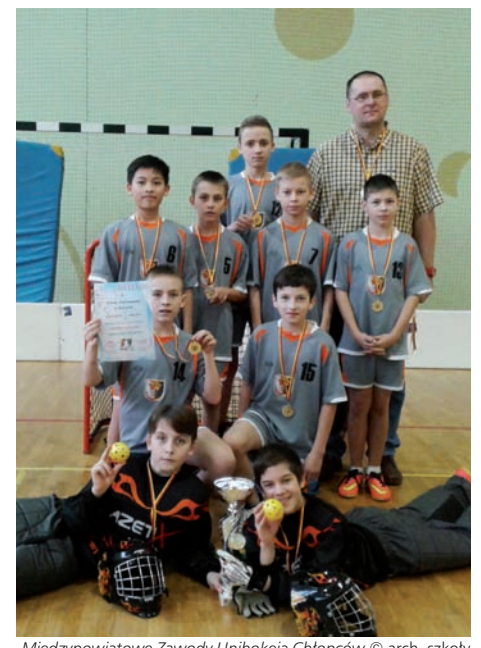
Międzypowiatowe Zawody Unihokeja Chłopców