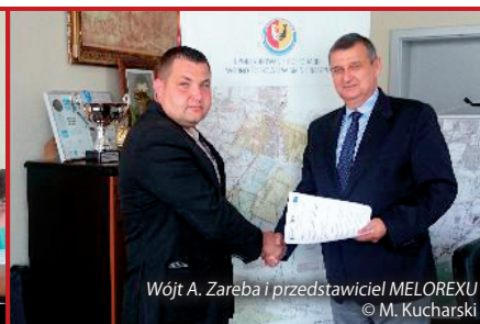
Wójt A. Zaręba i przedstawiciel MELIOREX