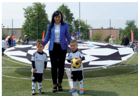
Wczesnie zaczyna, kto mistrzem chce być

Podobnie, jak w ubiegłorocznych turniejach, zespoły losowały jedną z 16 najlepszych drużyn (biorącej udział w prawdziwej Lidze Mistrzów UEFA sezonu 2014/2015), której barwy reprezentowały przez cały turniej.