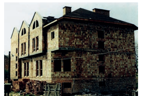
Budynek Cechu – grudzień 1988 r.