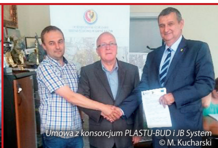
Umowa z konsorcjum PLASTU-BUD i JB System