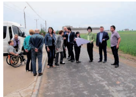
Radni Powiatowi – wizja na drogach

ze stanem technicznym dróg powiatowych wskazanych przez nas w czasie ilustracji, na kolejnych komisjach merytorycznych, radni oraz zarząd powiatu będzie pracować nad „strategią rozwoju” oraz planami inwestycyjnymi sieci dróg, których realizacja nastąpi już w obecnej kadencji.