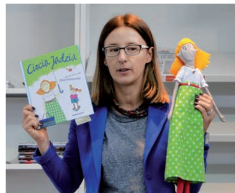
Silna grupa gimnazjalistów