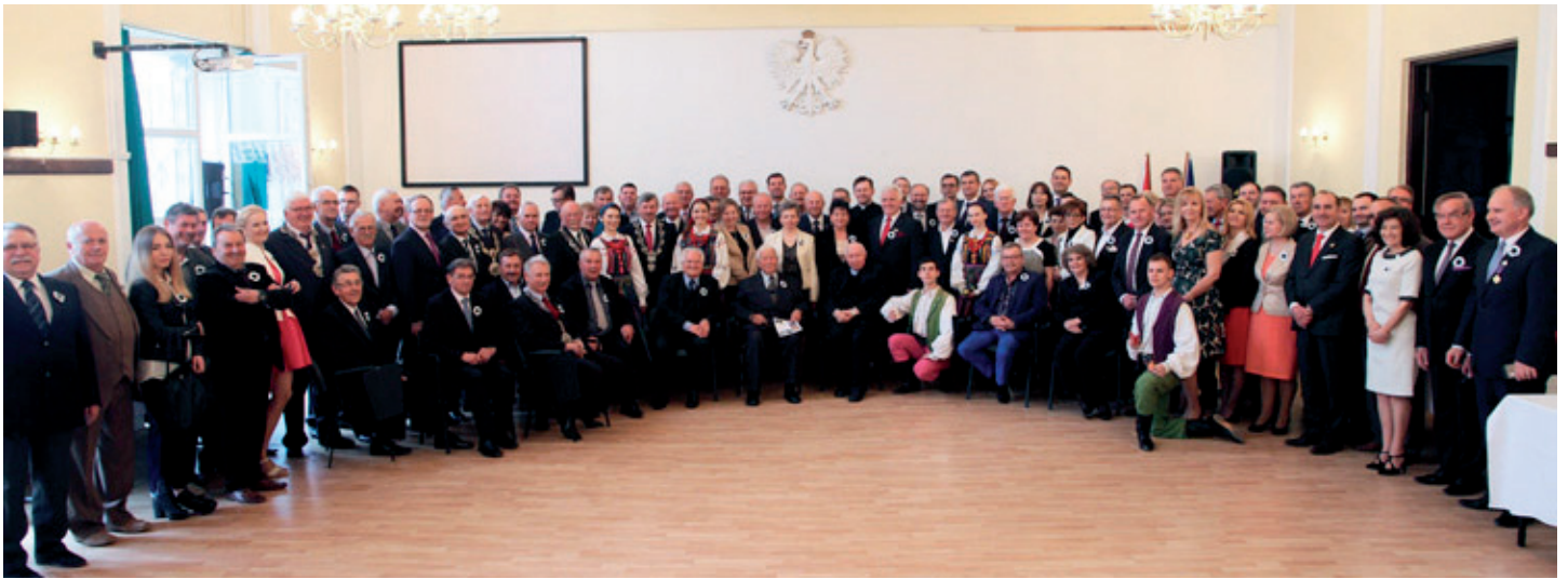
Obchody 30. lecia Cechu

W 2015 r. minęło 30. lat od chwili powołania w Raszynie Rejonowego Cechu Rzemiosł Różnych w Raszynie , który swoim zasięgiem obejmował w owym czasie 628 zakładów z terenu Gminy Raszyn (580 zakładów) i Gminy Tarczyn (62 zakłady). Pierwsze Walne Zgromadzenie, które podjęło uchwałę o utworzeniu organizacji oraz treści Statutu, miało miejsce 22 grudnia 1984 r., zaś 18 marca 1985 r. – został on zarejestrowany w Urzędzie Miasta Stołecznego Warszawy i wpisany jako „Rejonowy Cech Rzemiosł Różnych”.