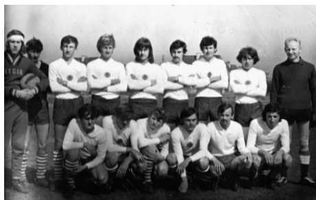
Pilkarze KS Raszyn z trenerem przed rozpoczęciem meczu