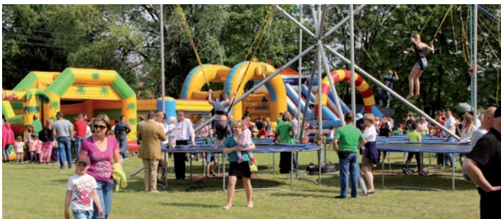
Wesołe miasteczko