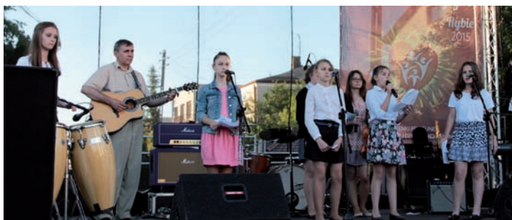
Aveto Papa z Rybia