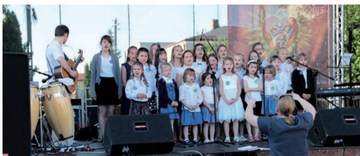
Schola-la-la z Dawid Bankowych