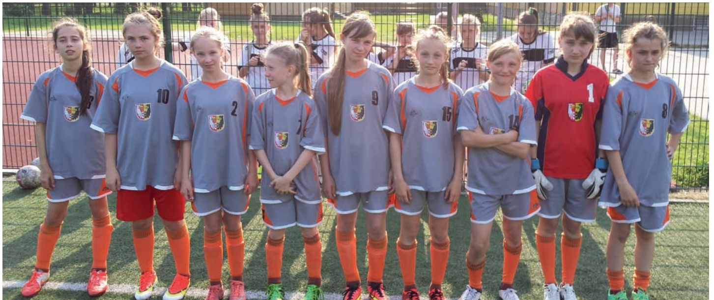
Wojewódzki Finał XVII MIMS w Piłce Nożnej

Kończący się rok szkolny 2014/2015 upłynął pod znakiem wielu zwycięstw w zawodach sportowych. Nasi uczniowie w wielu dyscyplinach zakwalifikowali się do etapu wojewódzkiego, aby tego dokonać musieli wygrywać w rywalizacji na poziomie gminy, powiatu i międzypowiatu . Złote medale i puchary cieszyły nie tylko młodzież, ale i kadre nauczycieli wychowania fizycznego. Braliśmy udział aż w sześciu Wojewódzkich Finałach XVII Mazowieckich Igrzysk Młodzieży Szkolnej . A oto szczegółowe informacje: