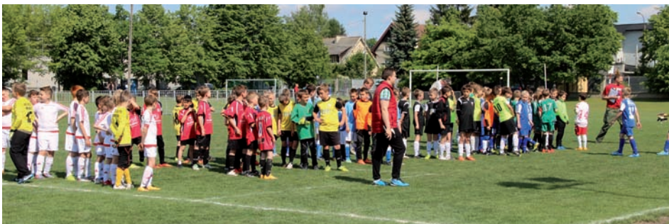
Po rozgrywkach