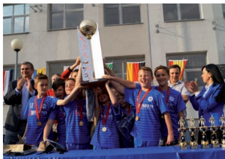
Zwycięska drużyna

W ramach ceremonii otwarcia pokaz hiphopowego tańca dali członkowie klubu Grawitacja z Piaseczna. Najlepsze drużyny oraz piłkarze zostali uhonorowani pucharami oraz statuetkami. Wszyscy piłkarze otrzymali plecaki ufundowane przez Centrum Handlowe Janki. Jak każdego roku wsparcia młodym zawodnikom udzielili liczni sponsorzy, a wśród nich Espes, Bank