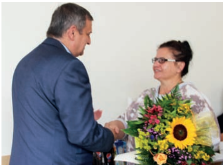
Podziękowania dla p. H. Koper