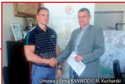
Umowa z firmą KANWOD