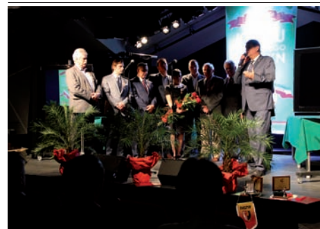
Obchody w CKR