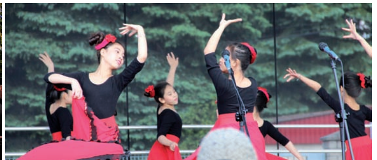
Występ wietnamskiego zespołu