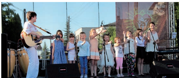
Schola z Sękocina