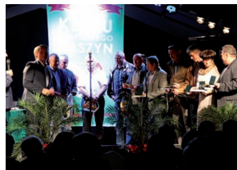
Uroczystość 50. lecia