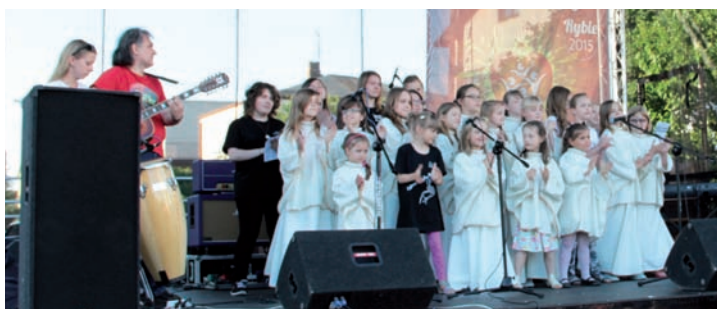
Promyki Opatrzności Bożej z Raszyna