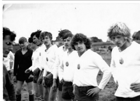
Lata 60, 70 – na terenie stadionu w Raszynie