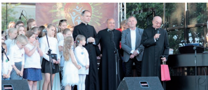
Podziękowania za koncert