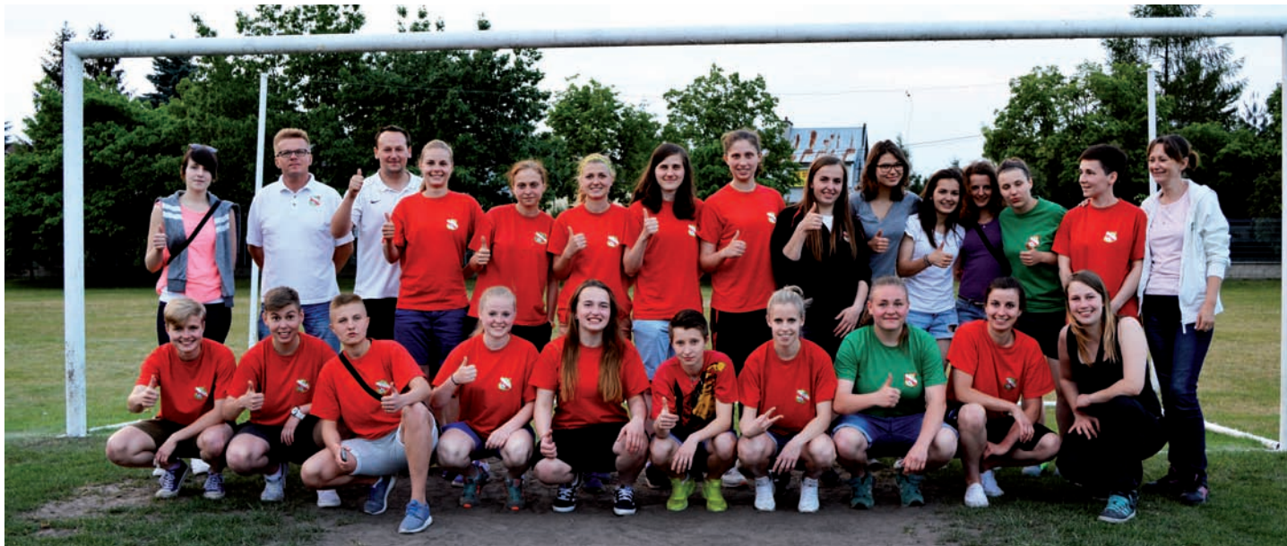
Drużyna z trenerami

Takie hasło można było usłyszeć w ubiegłą niedzielę na stadionie Kazimierza Jedynka w Raszynie, gdzie nasze piłkarki cieszyły się z upragnionego awansu. To historyczne osiągnięcie; dziewczyny wywalczyły zwycięstwo w przedostatniej kolejce pokonując drużynę z Ostrofki 5:1. Przy pełnych trybunach, na środek boiska raszynianki zostały wyprowadzone przez juniorki młodsze KS Raszyn. Licznie obecni na stadionie kibice mogli obejrzyć niezwykle widowiskowe spotkanie. Gospodynie nie zawiodły swoich sympatyków i przez cały pojedynek grały bardzo ofensywną piłkę, zmuszając bramkarke gości do coraz to liczniejszych interwencji. Po ostatnim gwizdku sędziego na murawie rozpoczęła się prawdziwa feta, która później przeniosła się do szatni. Raszynianki w otoczeniu tryskających szampanów, rozpoczęły taniec radości dumnie skandując: „PIERWSZA LIGA, PIERWSZA LIGA, W RASZYŃNIE!” Cel postawiony przed rozpoczęciem sezonu został osiągnięty. Niezwykle ciężka praca wykonana na przestrzeni ostatnich lat dała naszym zawodniczkom upragniony sukces. Ostatnie ligowe spotkanie nasze dziewczyny rozegrają 13 czerwca w Mońkach.