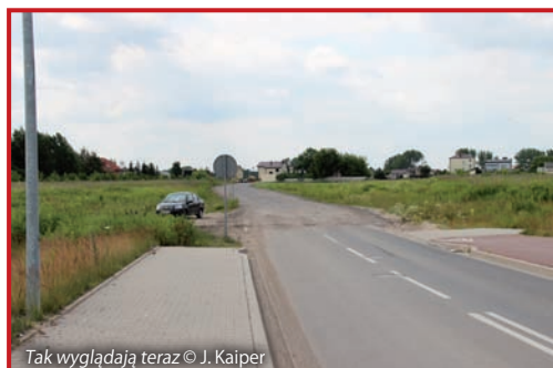
Tak wyglądają teraz