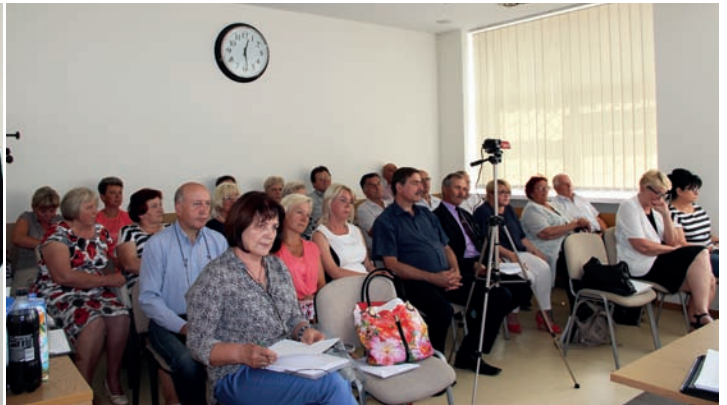
Sołtysi i Przewodniczący Rad Osiedli kadencji 2015-2019

Trzydziestego czerwca odbyła się wyjątkowo długa, bo trwająca od godziny 12 do 22, X Sesja Rady Gminy Raszyn. Porządek obrad przewidywał aż dwadzieścia osiem punktów, w tym, na początku, po otwarciu obrad i przyjęciu protokołu z IX Sesji Rady Gminy, sprawozdanie z wyborów sołeckich i uroczyste wręczenie zaświadczeń o wyborze, dopiero co wybranym sołtysom.