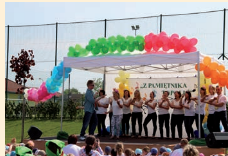
Przy takich nauczycielach dzieci muszą być wspaniałe

piosenki uwielbiają wszystkie przedszkolaki. Pani Majka tańczyła i śpiewała, a dzieci z radością jej w tym towarzyszyły. To była super zabawa.