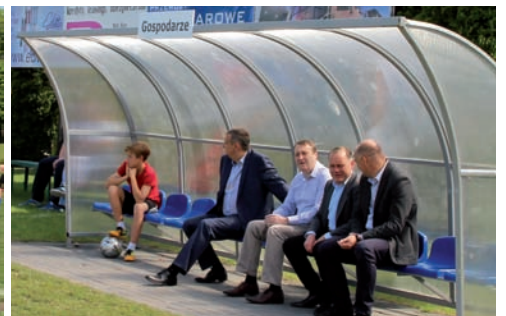
Na ławce gospodarzy

W tym roku lista organizatorów Międzynarodowego Dnia Dziecka w Raszynie była znacznie bogatsza, co powodowało, że było jeszcze więcej atrakcji niż zazwyczaj. Dzięki pracy Urzędu i Rady Gminy Raszyn, Centrum Kultury Raszyn, KS Raszyn, Gminnego Ośrodka Sportu i Gminnego Ośrodka Kultury, Szkole Podstawowej im C. Godebskiego w Raszynie oraz Stowarzyszeniu Wietnamczyków – Oddział w Raszynie program imprezy dla najmłodszych był niezwykle urozmaicony. Cały dzień, od godz. 9 rano wypełniały kolejne punkty programu, tak ciekawe i różnorodne, że dla uczestników czas mijał niepostrzeżenie.