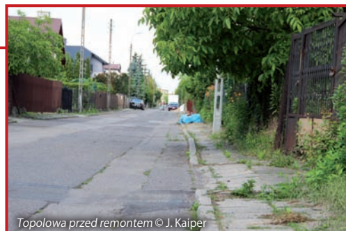
Topolowa przed remontem

Dziurawa jezdnia, chodniki rozjeżdżone i powykrzywiane od korzeni. Niedługo wszystko się zmieni, podpisano umowę na „Przebudowę ul. Topolowej we wsi Rybie gm. Raszyn” w trybie przetargu nieograniczonego ze zwycięską firmą: MMDB Tomasz Kowalski z Warszawy. Przebudowana Topolowa, o długości 557 metrów, będzie miała jezdnię o szerokości 5,5 m, z szarej kostki, a podjazdy do posesji z czerwonej. Przewidziano również, co ucieszy mieszkańców, przebudowę kanału deszczowego. Od 30 września br., za 616 749 zł, z pięcioletnią gwarancją, Topolowa stanie się jedną z piękniejszych ulic Gminy Raszyn. Ale nic za darmo, mieszkańców czekają, niestety, utrudnienia.