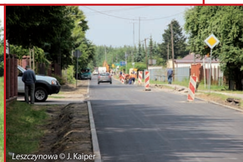
Leszczynowa © J. Kaiper