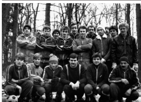
Trening biegowy KS Raszyn w Falentach