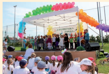
Występ jednej z grup przedszkolnych

Ukoronowaniem imprezy był występ gościa specjalnego - Majki Jeżowskiej, której