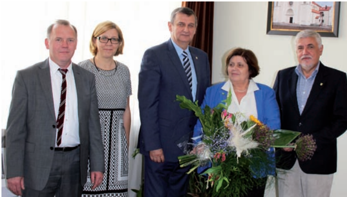
Tuż po przyjęciu jednogłośnie przez Radę Gminy Raszyn absolutorium za rok 2014