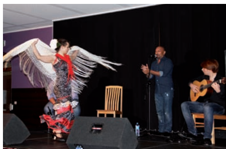
D'ARTE © M. Kaiper

Taniec flamenco to jeden z elementów bogatej, barwnej i działającej na zmysły kultury hiszpańskiej. Źródłem tańca należy poszukiwać u andaluzyjskich Cyganów, choć według niektórych źródeł wywodzi się bezpośrednio