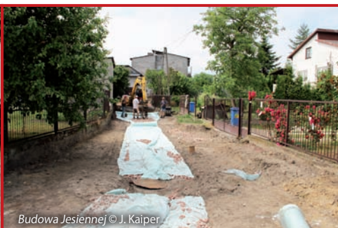
Budowa Jesiennej © J. Kaiper