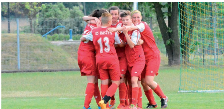
Radość ze zwycięstwa