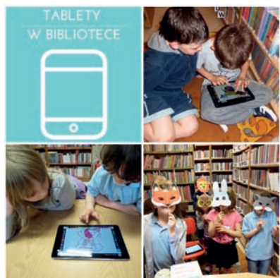
Podczas warsztatów