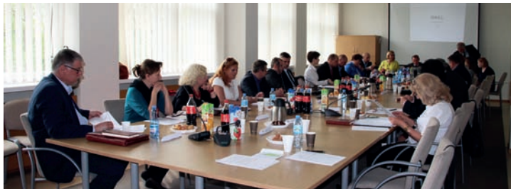
VIII Sesja Rady Gminy Raszyn