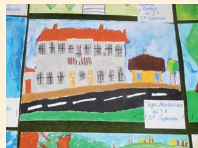
IGA MOCHOCKA KL. 1B