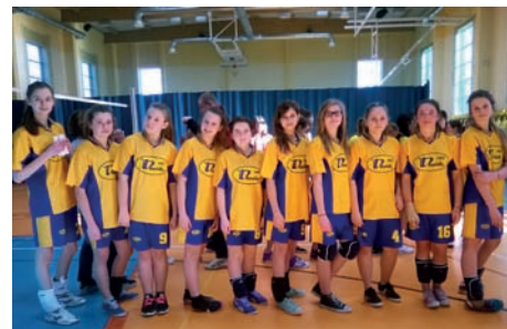
Super dziewczyny z Ład

18 marca 2015, zaledwie dwa dni po zawodach piłki siatkowej, w Michałowicach,