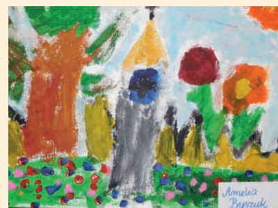
AMELIA BYSZUK KL. 2B