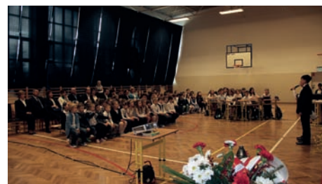
Podczas akademii