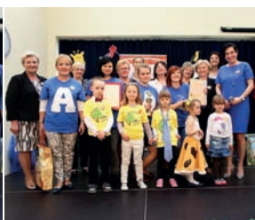
Delegacja z Przedszkola Pod Topołą