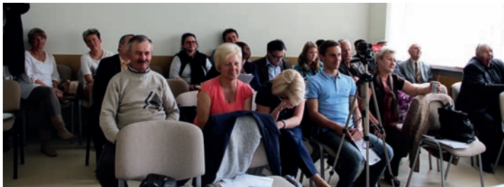
Sołtysi i Przewodniczący Zarządów Osiedli