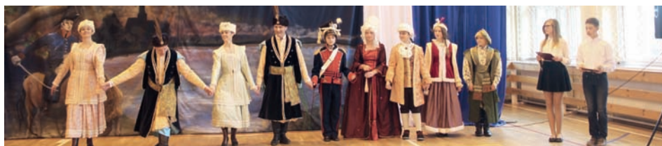
Z modą przez wieki