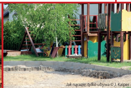
Jak narazie, tylko ubywa