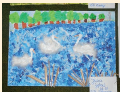
JULIA GĘBAŁ KL. 3 NAGRODA