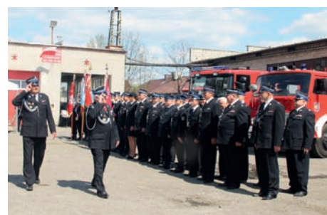
Przed strażnicą w Dawidach

zakończyła się oficjalna część uroczystości, po której gospodarze zaprosili gości na strażacki poczęstunek.