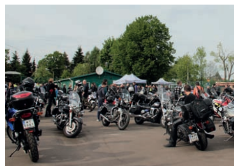
Imponujące jednoślady