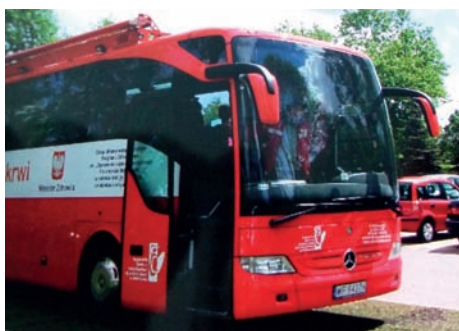
Autobus przed kościołem

Krwiodawstwo to społeczna akcja, której celem jest pozyskiwanie krwi od osób zdrowych na rzecz osób potrzebujących krwi