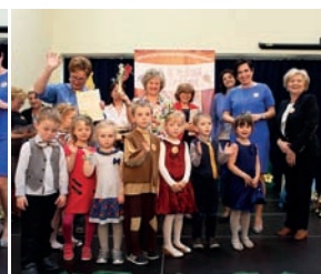
Delegacja z Sękocina