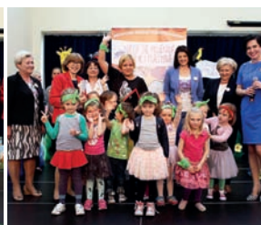
Delegacja z przedszkola w Falentach