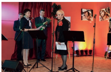
Podziękowania dla autorki wystawy