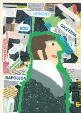
KAROLINA STASZEWSKA KL. 2E