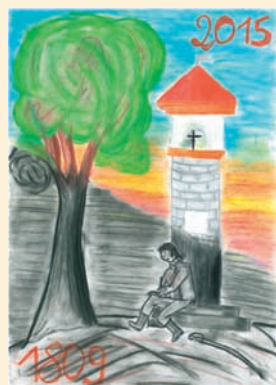
KAJETAN SZYM CZYK KL. 5D