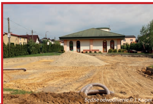
Będzie odwodnienie

To, co jeszcze niedawno było placem zabaw o powierzchni pokrytej grubym żwirem, jest teraz półmetrowej głębokości dołem, z którego sterczą tajemnicze niebieskie rury. Na trawniku obok stoją urządzenia do zabaw, czekając, kiedy znowu trafią we właściwe miejsca na nowej nawierzchni. Czekają maluchy, czekają ich rodzice, czekamy i my. Wykonawcy miecie się na baczności!