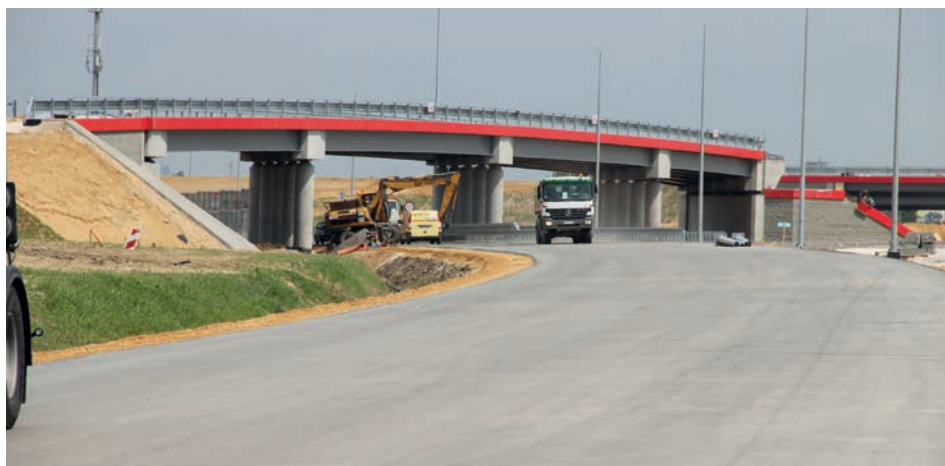
Szosa łącząca Obwodnicę z ul. Mszczonowską