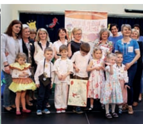
Delegacja z Bajkowego Przedszkola