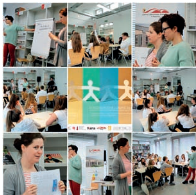
Silna grupa gimnazjalistów