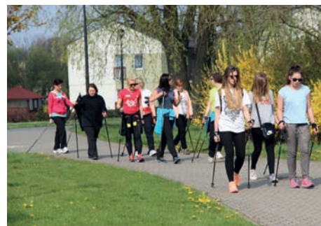
Chodzimy z kijami

25 kwietnia odbył się II Marsz z Kijkami Nordic Walking, na który mieszkańców gminy zaprosili: Dyrektor, Rada Pedagogiczna i uczniowie Szkoły Podstawowej w Ładach oraz Dyrektor GOS. Rano, pod budynkiem pływalni spotkała się liczna grupa osób w bardzo różnym wieku – od małych dzieci do seniorów. Pod opieką instruktora, który pokazał jak należy trzymać kij, a także jakie ćwiczenia można wykonywać w trakcie chodzenia, uczestnicy kilkakrotnie przemierzali teren parku w Raszynie. Na zakończenie mogli posilić się wspaniałymi jabłkami ufundowanymi przez organizatorów.