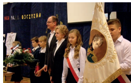
Delegacja gotowa do wyjścia