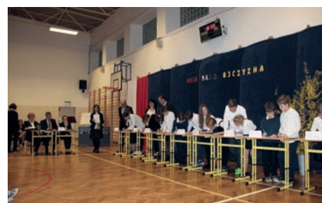
Quiz wiedzy o Patronie