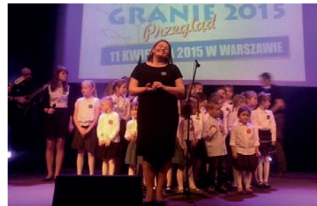
Artysta i publiczność