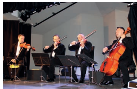
Grupa MoCarta na scenie CKR

Tym razem muzycy, w programie „Ale Czad”, przeprowadzili widzów przez swoje liczne podróże: Chiny, gdzie głównie koncertowali w małych chińskich miasteczkach poniżej 15 milionów mieszkańców, Francję, Kostarykę, Meksyk, Stany Zjednoczone i Czechy. Jak zwykle w repertuarze muzykę klasyczną przeplatały utwory rozrywkowe okraszane inteligentnym żartem, wywołującym salwy