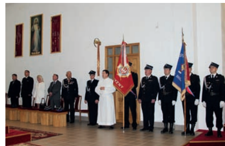
Msza Św. w kościele w Dawidach Bankowych