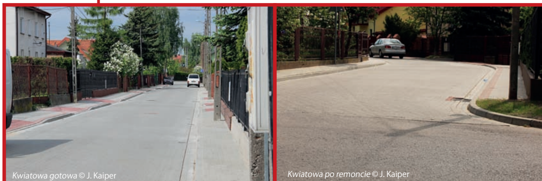
Kwiatowa gotowa

a krawężniki położone jak należy. Ulica została przyjęta do użytkowania. Miejmy nadzieję, zachowa dzisiejszą urodę przez najbliższe lata. W każdym razie, odnowiona Kwiatowa wygląda pięknie.