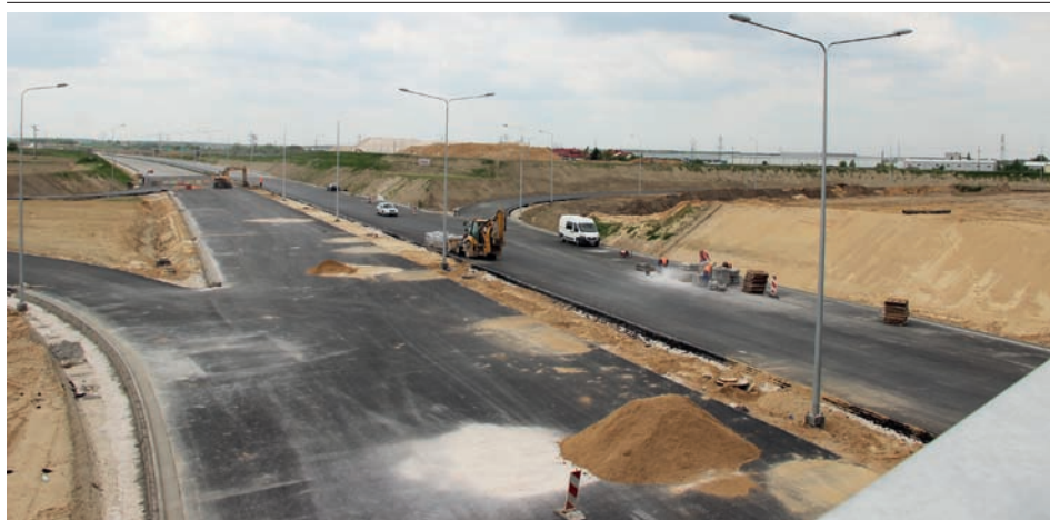
Z wiaduktu w stronę Janek ul. Sokołowska