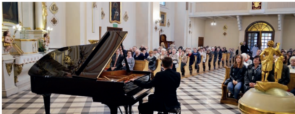
Artysta i publiczność

Konstytucja 3 Maja obowiązywała jedynie 14 miesięcy, ponieważ Sejm grodzieński aktem z dnia 23 listopada 1793 r. uznał Sejm Czteroletni za niebyły i uchylił wszystkie jego akty prawne. Polacy jednak pamiętali o tej wspaniałej karcie swojej historii i wkrótce