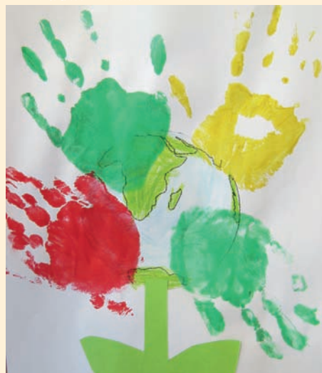
FILIP P. GRUPA TYGRYSKI