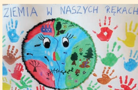
PUCHATKI WZIĘŁY ZIEMIĘ W SWOJE RĘCE