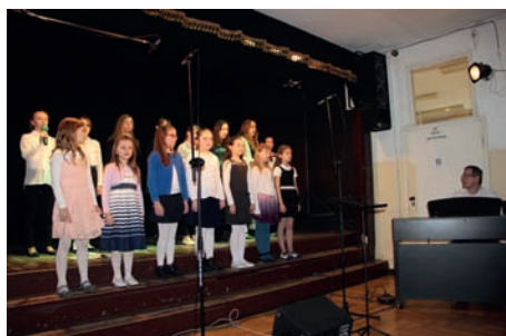
FLY SINGERS