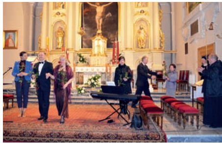
Wykonawcy i organizatorzy

Wieczorem została odprawiona uroczysta Msza Św. za ojczyznę i samorząd, po zakończeniu której odbył się koncert: „Najpiękniejsze Arie Operowe”. Na koncert mieszkańców gminy zaprosili: Wójt Gminy Raszyn, Rada Gminy Raszyn, Gminny Ośrodek Kultury w Raszynie oraz Parafia św. Szczepana w Raszynie.