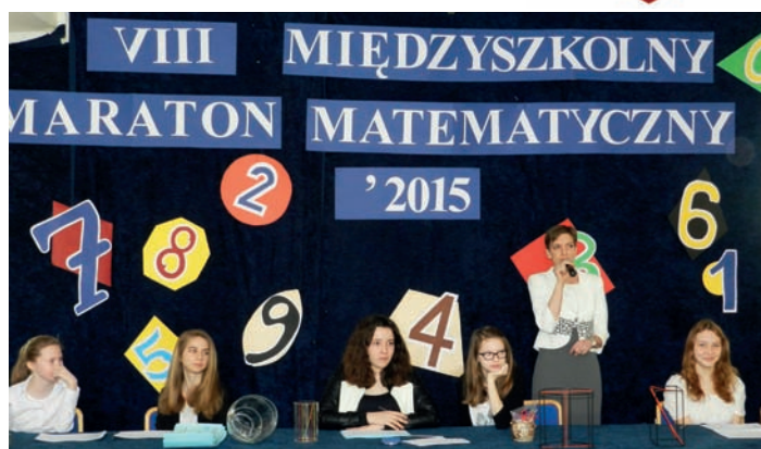
Maraton Matematyczny

Maraton Matematyczny stał się już szkolną tradycją. Konkurs nie tylko rozwija umiejętności matematyczne uczniów, ale też umacnia kontakty w społeczności szkolnej naszego regionu zarówno wśród uczniów jak i wśród nauczycieli.