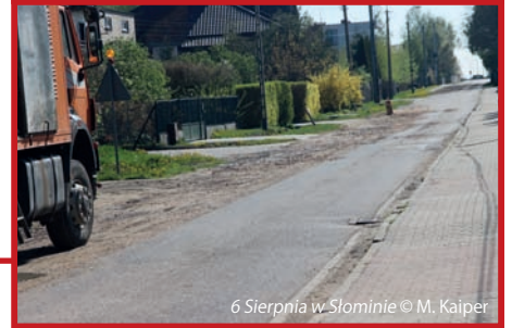
6 Sierpnia w Słominie