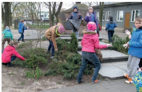
Dzieci porządkują teren wokół szkoły

Jak co roku wiosną w Szkole Podstawowej im. Cypriana Godebskiego odbyła się akcja „Dzień Ziemi”. Jej celem jest uświadomienie dzieciom, jak ważny jest ekosystem naszej planety. To też znakomita okazja do promowania