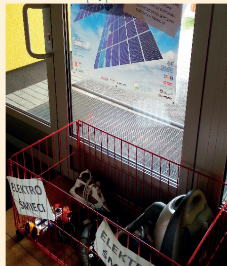
DZIECI ZBIERAJĄ ELEKTROŚMIECI