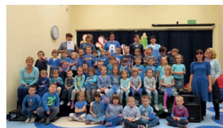
Niebiesko w Stumilowym Lesie © arch. przedszk