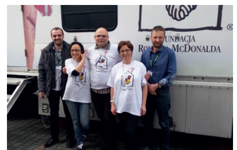
Wolontariusze z lekarzami