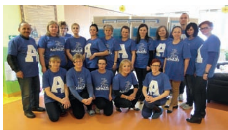
Pracownicy „Pod Topolą” na niebiesko