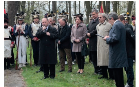
Uroczyste otwarcie Pikniku