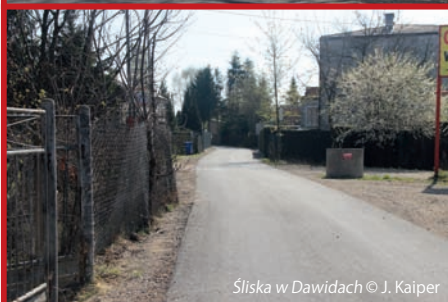
Śliska w Dawidach