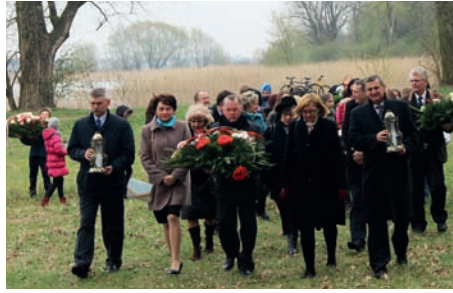
Na grobli

znajdującym się na cmentarzu w Puchałach, pod kamieniem upamiętniającym bitwę na Grobli Falenckiej oraz pod kapliczką ku czci Cypriana Godebskiego przy ulicy jego imienia w Raszynie.