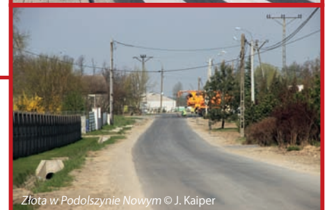
Złota w Podolszynie Nowym