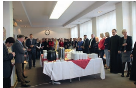
W Urzędzie Gminy Raszyn

Rodzinna atmosfera spotkania i uśmiechy na twarzach uczestników, były najlepszym świadectwem tego, że było to ze wszech miar