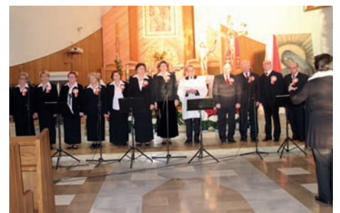
Program Zespołu Rybianie

Obydwie rocznice, jak co roku uczcili mieszkańcy uczestnicząc we Mszy Św. celebrowanej