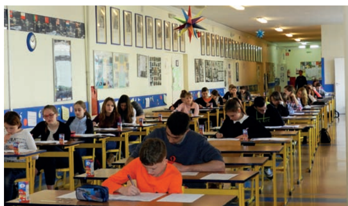
Maraton Matematyczny

Serdecznie gratulujemy najlepszym Maratończykom!!!