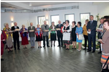
Życzenia Wielkanocne