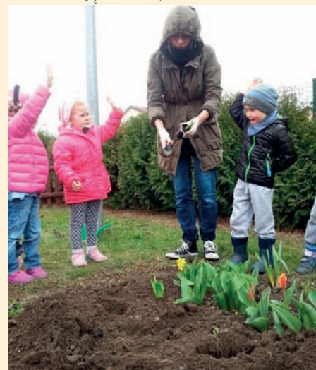
DZIECI POSADZIŁY KWIAITY I WARZYWA