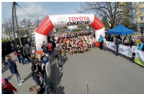
Zawodnicy na starcie