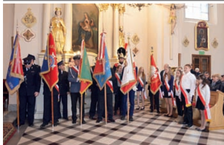
Poczty sztandarowe