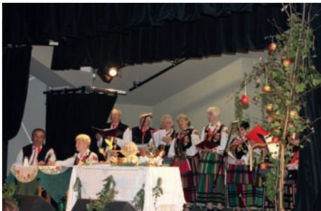
Chodzenie po dyngusie

We wtorek, 14 kwietnia, w Centrum Kultury Raszyn odbyła się, w terminie comiesięcznego spotkania Klubu, uroczystość Wielkanocna. Rozpoczęły ją występy Zespołu Barwy Jesieni, który na wspaniale udekorowanej scenie, z dużym talentem, zaprezentował ludowy obrzęd „Chodzenie po dyngusie”. Barwnie ubrani członkowie zespołu bawili nas wierszami, piosenkami, pokazując, że i dziś dawne obrzędy towarzyszące świętom