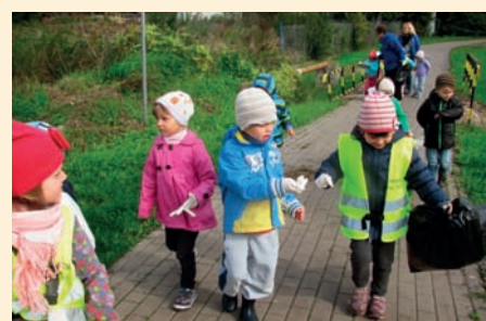
PRZEDSZKOLAKI SPRZĄTAJĄ TEREN WOKÓŁ PRZEDSZKOLA