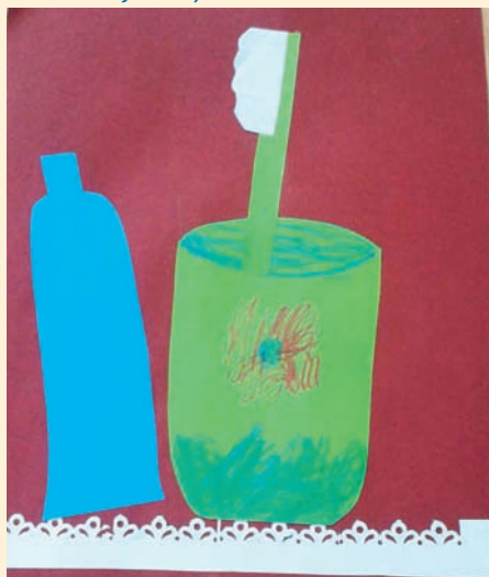
DBAM O ZĄBKI - HANIA, 4 LATA