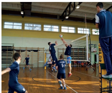
Mecz siatkówki