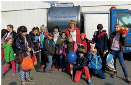
Tak obchodziliśmy Światowy Dzień Wody

W sobotę, 21 marca 2015 roku 18-osobowa grupa uczniów Szkoły Podstawowej im. Włodzimierza Potockiego w Sękocinie wzięła udział w pikniku organizowanym przez MPWiK w Warszawie z okazji Światowego Dnia Wody. W tym roku hasło przewodnie imprezy brzmiało: Woda i zrównoważony