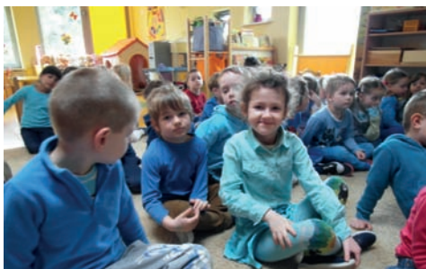
Niebieskie przedszkolaki