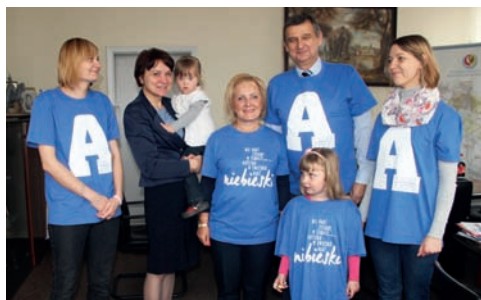
Niebiesko w gabinecie Wójta