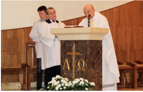
Ks. Prałat B. Kapalka