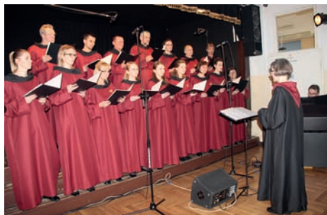
Chór Effatha

W tym roku, po raz pierwszy Rada i Wójt Gminy Raszyn, Sołtysi i Przewodniczący Zarządów Osiedli, Proboszczowie Parafii: Raszyn, Rybie, Dawidy i Sękocin, Dyrektorzy szkół i przedszkoli Gminy Raszyn oraz Gminny Ośrodek Pomocy Społecznej zaprosili mieszkańców gminy na Spotkanie Wielkanocne,