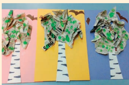
BRZOWOWY GAJ - STAŚ, 6 LAT