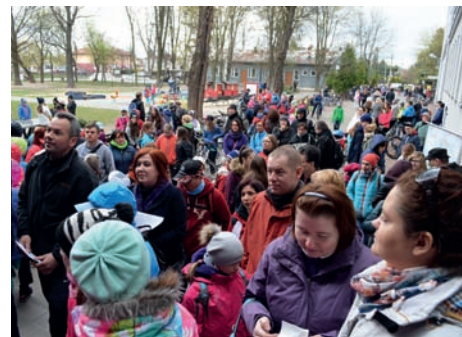
Przed rajdem

Uczestnicy odwiedzili 9 miejsc pamięci na terenie gminy Raszyn oraz miejsca pamięci na terenie Magdalenki i Okęcia. Uczniowie SP w Raszynie złożyli wiązanki pod pomnikiem