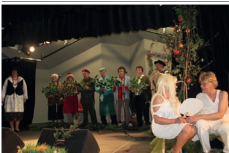
Kabaret Nowalijki