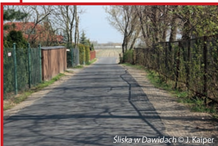
Śliska w Dawidach

Łagodna, prawie bezśnieżna i sucha zima sprawiła, że ekipy budowlane prawie nie przerywały prac przy budowie kanalizacji. Dotyczyło to zadań, na które przetargi rozstrzygnięto w ubiegłym roku. Wszystkie wchodziły w zakres inwestycji realizowanych w ramach dofinansowanego przez Fundusz Spójności UE, programu „Uporządkowanie gospodarki wodno-ściekowej w Gminie Raszyn”.