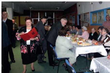
Przy wspólnym śniadaniu