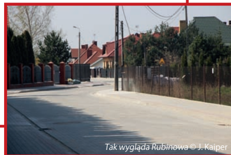
Tak wygląda Rubinowa