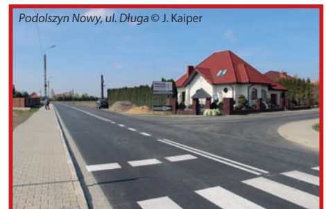
Podolszynie Nowy, ul. Długa