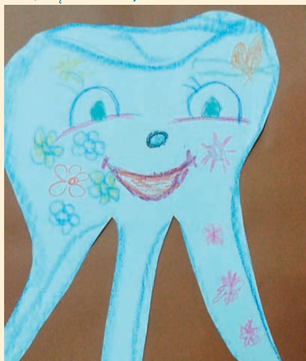
ZDROWY ZĄBEK. TERESKA, 5 LAT