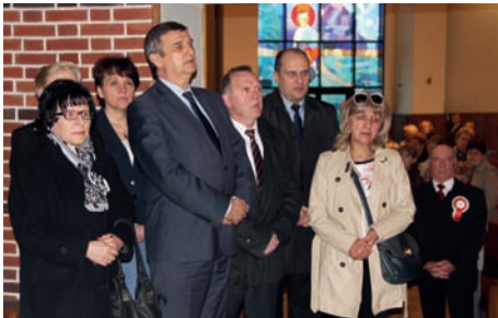
Delegacja samorządowców