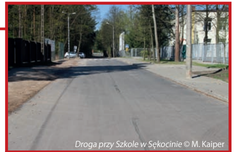
Droga przy Szkole w Sękocinie

Obecnie pozostał do wykonania kolektor na Leśnej w Laszczkach, wymagający przeprojektowania oraz odtworzenie części nawierzchni w 6 Sierpnia w Słominie. Reszta drogi oraz Wierzbowa, prowadząca do SP w Sękocinie, na szczęście jest już gotowa.