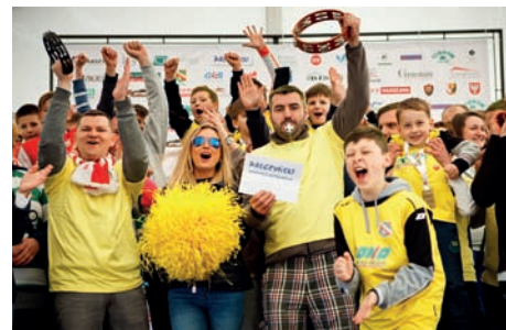
Najlepsi kibice