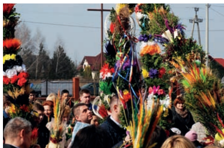
Palmowa Niedziela w Dawidach Bankowych

cowały liczne grupy mieszkańców: uczniowie i nauczyciele klas szkolnych i przedszkolnych, kluby seniora oraz pojedyncze osoby. Pierwsze miejsce przyznano twórcom 15 palm, drugie miejsce – 10 wykonawcom, zaś trzecie – 5. Ponadto wyróżniono 5 uczestników konkursu. Pełna lista laureatów znajduje się na str. www.gok.raszyn.bip.net.pl w zakładce – konkursy. Patrząc na urodę palm nietrudno pojąć, z jakimi problemami borykała się komisja przyznając laury.