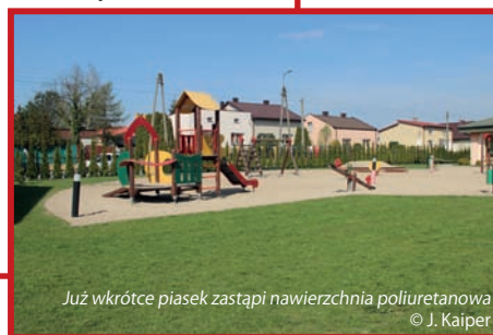
Już wkrótce piasek zastąpi nawierzchnia poliuretanowa

Teren placu zabaw zostanie też odwodniony. Do przetargu stanęło 5 firm, spośród których najkorzystniejszą cenowo ofertę złożyła firma C.G.A. FRU-MAL Development Sp. z o.o. z Warszawy, proponując wykonanie inwestycji za kwotę 249 268 zł.