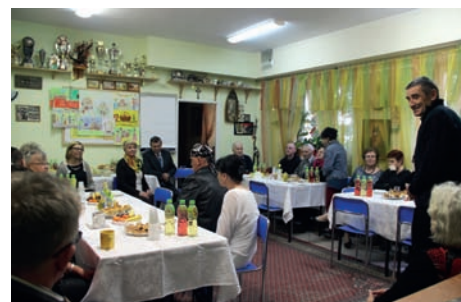
Wielkanoc w ARCE

30 marca, podczas Obchodów Ogólnopolskiego Dnia Trzeźwości, na spotkaniu Wielkanocnym spotkali się członkowie Raszynskiego Stowarzyszenia Rodzin Abstynenckich ARKA.