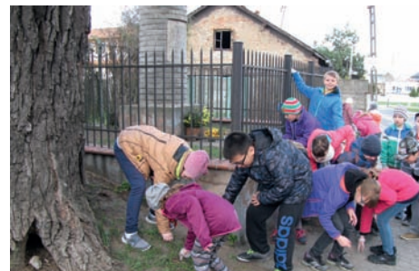
Porządkowanie terenu wokół kapliczki

Akcja „Dzień Ziemi” przypomina nie tylko najmłodszym mieszkańcom Raszyna, że wszyscy jesteśmy odpowiedzialni za naszą planetę. Jest doskonałą okazją do refleksji