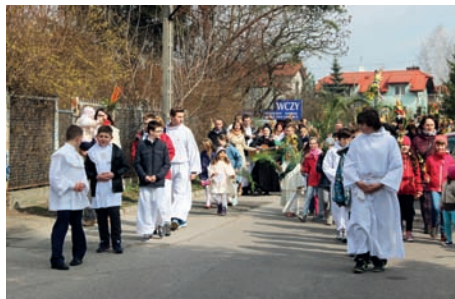
Procesja z palmami

W tym roku, już po raz XIV Gminny Ośrodek Kultury przeprowadził konkurs Raszyńskie Palmy Wielkanocne. Nad wykonaniem różnokolorowych, mniejszych i większych palm pra-