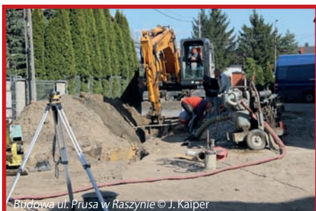
Budowa ul. Prusa w Raszynie