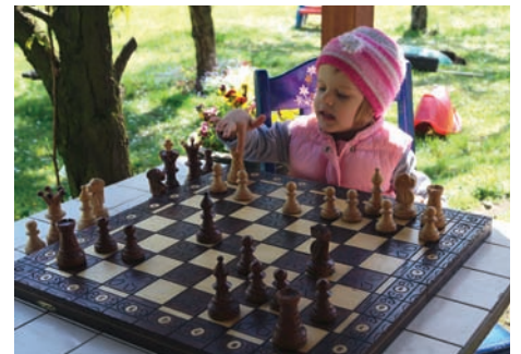
Edukacja domowa

Edukacja domowa, wbrew temu, co sugeruje nazwa, nie ogranicza się tylko do uczenia się we własnych czterech ścianach. Dzieci pod czujnym okiem rodziców, indywidualnych nauczycieli – mentorów, jak i samodzielnie, zdobywają wiedzę w sposób bardzo kreatywny, innowacyjny, wykraczając zwykle daleko poza ramy wyznaczone przez podręcznik. Korzystają z różnorodnych materiałów, nie tylko z książek. Biorą udział w prelekcjach, otwartych warsztatach i projektach badawczych, lekcjach muzealnych, kołach zainteresowań i wycieczkach. Wiedzę opanowują globalnie. Nie bez znaczenia jest też socjalizacja.