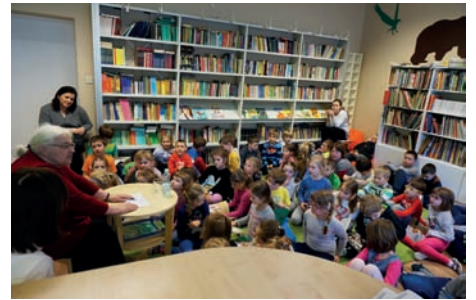
Dzieci słuchały zafascynowane