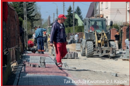
Tak budują Kwiatow

Najtrudniej jest na Prusa, gdzie budowa drogi wymaga wykonania kanału odwadniającego. Ten etap prac zmierza ku końcowi, a po nim przyjdzie kolej na chodniki i nawierzchnię ulicy.