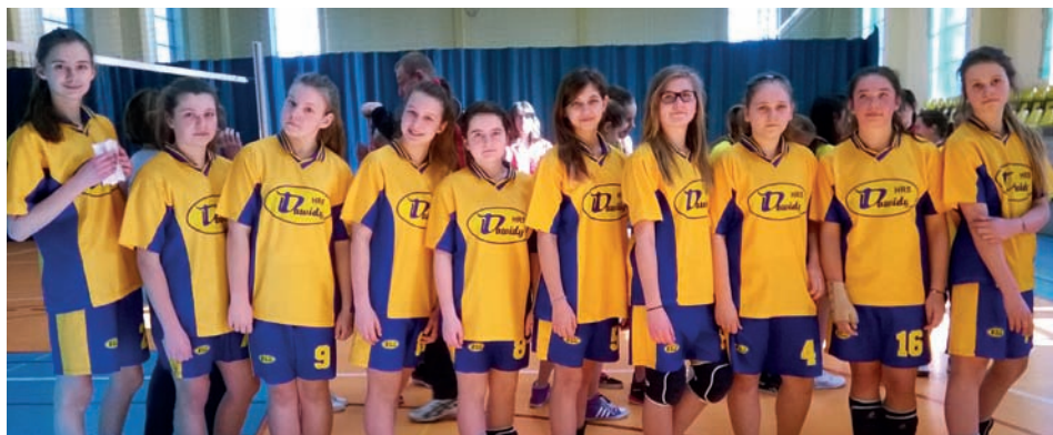
Wspianiała drużyna z Ład