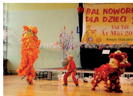
Taniec Lwów