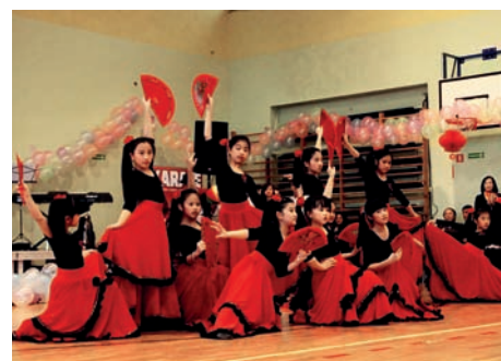
Białe Lotosy wykonuje taniec Flamenco © Nguyen Minh Thanh