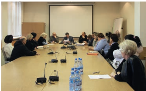
Posiedzenie Komisji Rewizyjnej