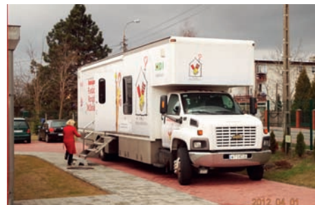
Ambulans przez Przedszkolem pod Topolą