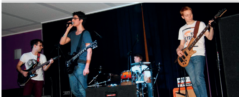
Rock na Rybiu