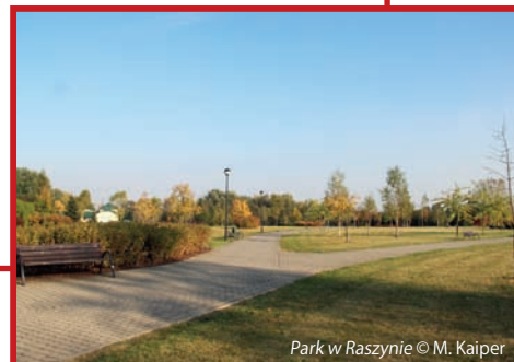
Park w Raszynie

W bieżącym roku, podobnie jak w ubiegłym, przetarg na wycinkę i pielęgnację drzew na terenie gminy wygrała nasza rodzima firma z Rybia – AGAdendron Sp. J. Zakładanie i Pielęgnacja Terenów, oferując cenę brutto 91 145,00 zł.