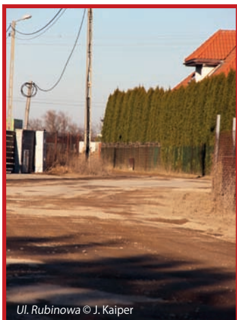
Ul. Rubinowa