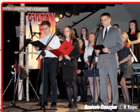
Gimnazjum © M. Kaipeer