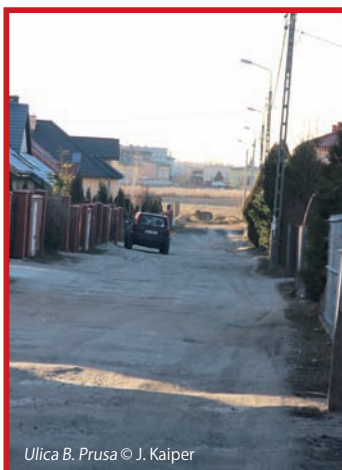
Ulica B. Prusa

W wyniku postępowania, do którego swój akces zgłosiły 4 firmy, wybrano firmę ALDAR Artur Soszyński Projektowanie Sieci i Instalacji Sanitarnych z Warszawy, która zaoferowała cenę brutto 41 692,20 zł. Zadania mają być zakończone do 30 listopada 2015 r. Warto dodać, że szacunkowa wartość zamówienia wynosiła ponad 87 tys. zł.