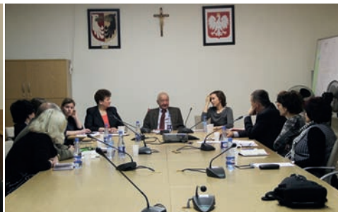
Posiedzenie Komisji Zdrowia