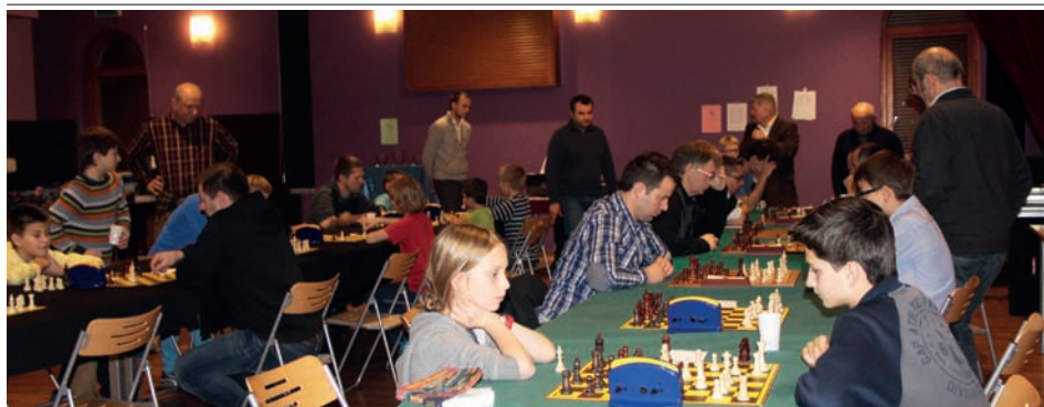
Turniej szachowy