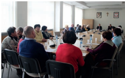
Posiedzenie Komisji Porządku Publicznego