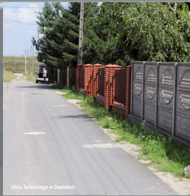
Ulica Terleckiego w Dawidach