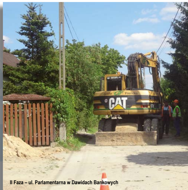
II Faza – ul. Parlamentarna w Dawidach Bankowych