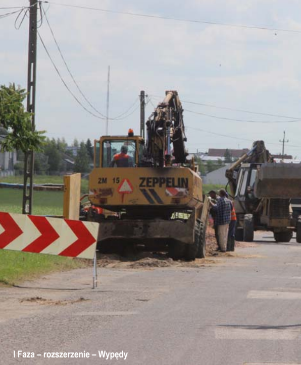
I Faza – rozszerzenie – Wypędy