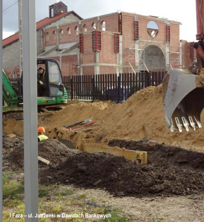
I Faza – ul. Jutrzenki w Dawidach Bankowych