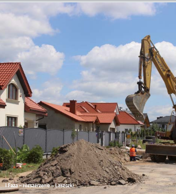
I Faza – rozszerzenie – Laszczki

dofinansowanie w wysokości 15 615 230 zł na budowę 10,95 km sieci kanalizacyjnej i 388,5 mb sieci wodociągowej w ramach następujących zadań: