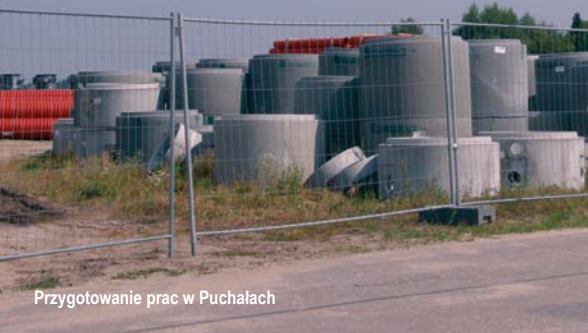
Przygotowanie prac w Puchałach