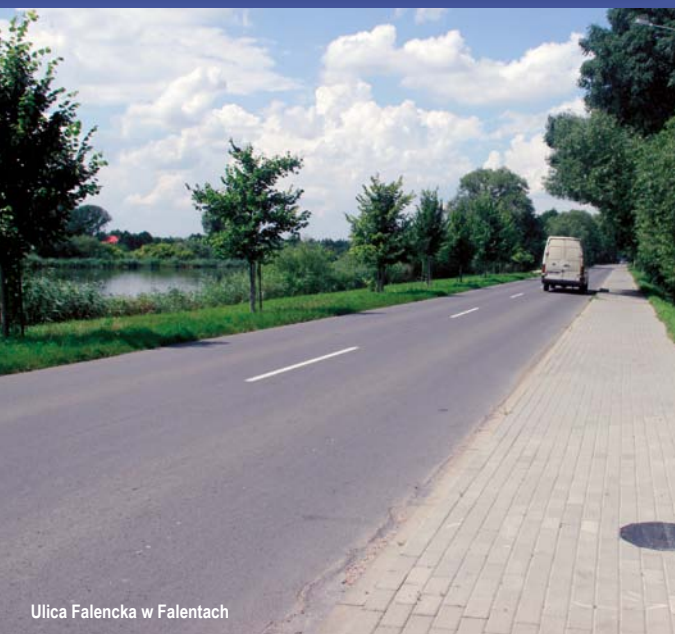
Ulica Falencka w Falentach

Realizacja projektu przyniosła znaczące korzyści o charakterze środowiskowym, kulturowym i cywilizacyjnym. Stworzenie 96% mieszkańców Gminy Raszyn możliwości podłączenia do zbiorczego systemu odbioru ścieków znacząco ogranicza zanieczyszczenie środowiska, poprawia czystość wód gruntowych i powierzchniowych, powietrza, jakość gleb oraz wody pitnej, a w efekcie ogólny stan sanitarny Gminy Raszyn, stan zdrowia i komfort życia mieszkańców, ale też obecnej tu fauny i flory. Zmiany, które zaszły są wyrazem znaczącego skoku cywilizacyjnego i świadectwem dbałości o ochronę zasobów wody pitnej dla przyszłych pokoleń. Projekt przyczynił się również do wzrostu atrakcyjności inwestycyjnej i turystycznej gminy. Realizacja przedsięwzięcia dostosowała gospodarkę wodno-ściekową Gminy Raszyn do wymogów prawa polskiego oraz dyrektyw UE.