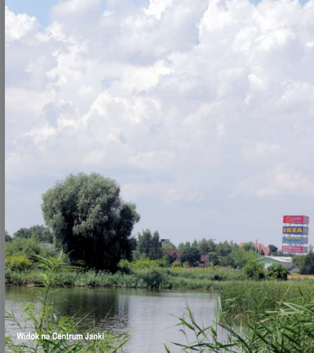
Widok na Centrum Janki

Jak wynika z tabeli ostateczny zakres inwestycji jest znacznie większy niż założono w pierwszej umowie. W czterech Fazach wraz z rozszerzeniami wykonano lub w najbliższym czasie zostanie wykonane 73,9 km sieci kanalizacji sanitarnej i 10,21 km sieci wodociągowej, w miejsce zaplanowanych w pierwszej umowie 34,5 km kanalizacji i 5,5 km wodociągów. Łatwo policzyć, że zakres inwestycji i dofinansowania powiększono ponad dwukrotnie. Warto też zauważyć, że zdecydowana większość inwestycji, szczególnie kanalizacyjnych, powstała w latach 2011-2014. Dotyczy to 56,15 km sieci kanalizacyjnej (76%) i 4,71 km wodociągowej. To niewątpliwym sukcesem obecnej kadencji.