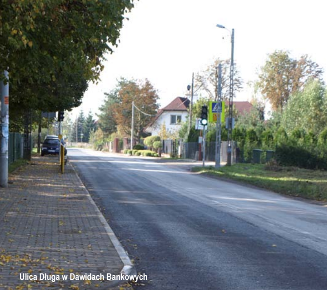
Ulica Długa w Dawidach Bankowych