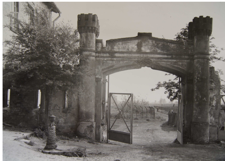
Stan w 1960 r., archiwum WUOZ